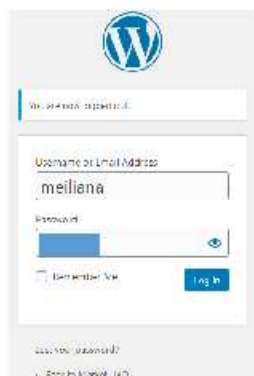
Gambar 1. Form Login

Sebelum memasuki halaman website marketplace, Anda diharuskan melakukan login terlebih dahulu dengan memasukkan username dan password → tekan tombol Login pada form login.