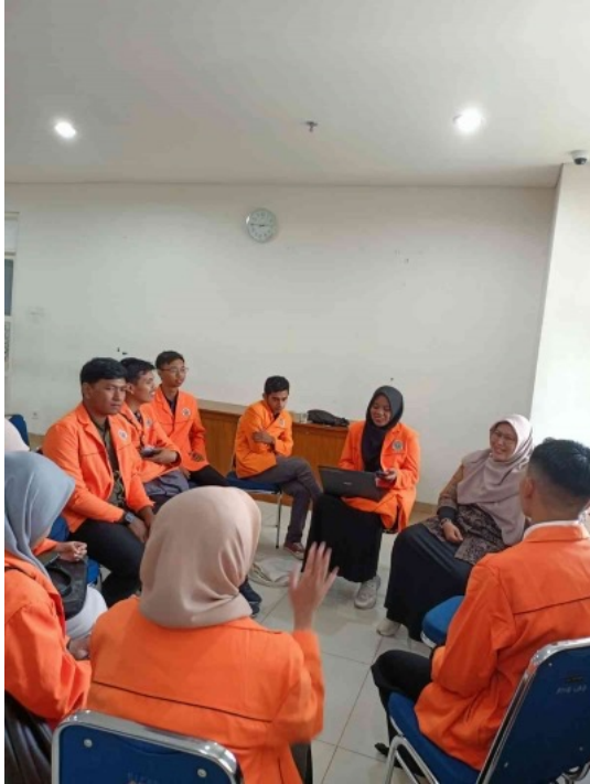
Kegiatan PPK Ormawa UAD