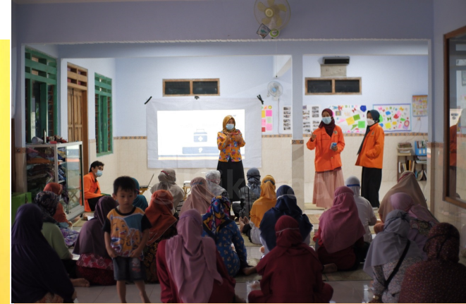
Kegiatan PKM skema Pengabdian kepada Masyarakat oleh mhs UAD

"Adapun hamba-hamba Allah Yang Maha Pengasih itu adalah orang-orang yang berjalan di bumi dengan rendah hati." (QS Alfurqan [25]: 63)