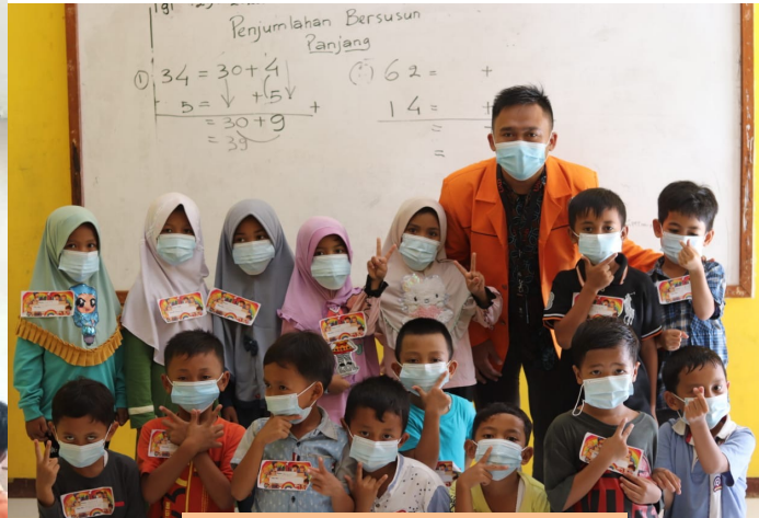
Kegiatan Dahlan Muda Mengabdi